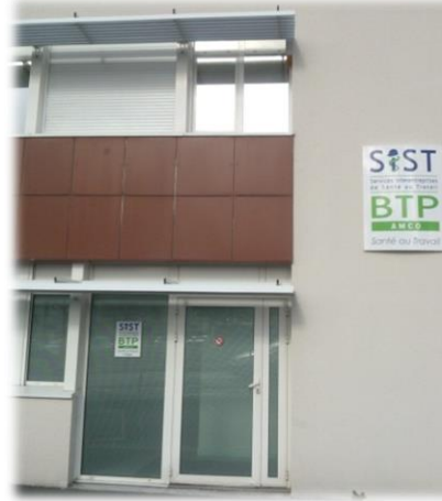
Maison du Bâtiment et des Travaux Publics- AMCO Périgueux.