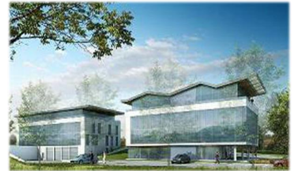
Pôle régional du Bâtiment et des Travaux Publics- AMCO Limoges.